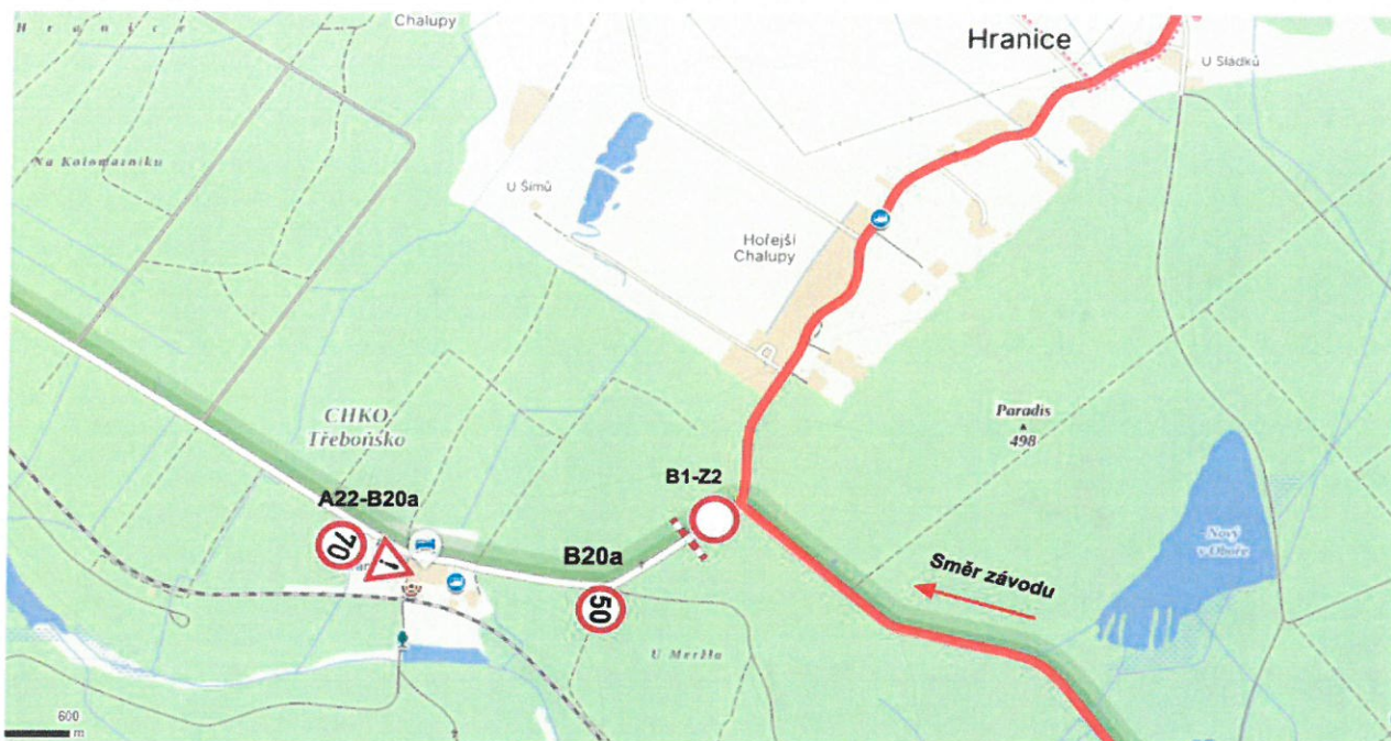
Situace č. 5 – Dvory nad Lužnicí